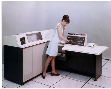
Fotografía que muestra un UNIVAC DCT2000, equipamiento desde el que se accedía al UNIVAC 1100 del MEC desde los distintos Centros de Cálculo

Los Centros de Cálculo creados disponían como principal recurso de un terminal (UNIVAC DCT2000, Figura 1) que se conectaba a través de un modem telefónico de 2.400 baudios (aproximadamente 2,5 Kbits/s) al Centro de Cálculo y de Proceso de Datos del Ministerio de Educación. Todos los accesos se hacían por medio de tarjetas perforadas, y la única operación autónoma que podían realizar los DCT2000 era imprimir tarjetas.