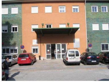
Entrada al Edificio Mecenas, Campus Universitario de Fuentenueva, tal como se encuentra en la actualidad (2016)

En 1980 con un fondo de 103 millones pesetas formado con aportaciones del Ministerio de Educación (48 millones), Ministerio de Universidades e Investigación (22 millones) y de las propias universidades (33 millones) se potencian los centros de cálculo de 14 universidades, incluyendo la de Granada; en la que se instala un computador autónomo (Data General Eclipse S250).