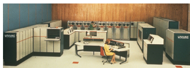
Configuración de un UNIVAC 1106

El Centro de Cálculo y de Proceso de Datos del Ministerio de Educación y Ciencia se creó en 1969 para agilizar y perfeccionar la gestión administrativa del Ministerio y para fomentar la informática en la Universidad facilitando la resolución de los procesos de cálculo en trabajos de investigación desarrollados por centros de enseñanza superior y organismos de investigación. El equipo inicial del Ministerio estaba constituido por un UNIVAC 1108, con los periféricos correspondientes, que fue adquirido con la ayuda de un préstamo del Banco Mundial de unos 200 millones de pesetas y ampliado en 1971 con una cantidad similar. La utilización de este computador por investigadores y docentes se realizaba a través de una “Red de Usuarios Externos” que incluía a los usuarios que accedían, por un lado, directamente al centro (ubicado en la calle Vitrubio) y, por otro, a través de los Centros (Remotos) de Cálculo citados anteriormente.