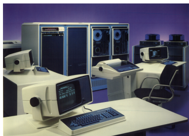
Computador Data General con terminales Dasher 100 y Dasher200, impresora, y (al fondo a la derecha) unidades de disco de 50 MB

El Eclipse S/250 disponía inicialmente 256 KB de memoria y dos discos de 5 MB (uno de ellos intercambiable), posteriormente se amplió la memoria a 1,5 MB y se añadió una unidad de disco tipo lavadora de 50 MB. En el Eclipse, con sistema operativos AOS, se podían compilar programas de 64 kB como máximo. Había que hacer muchas cábalas con las variables para que el programa tuviese menos de esa capacidad. Había una impresora de aguja para los listados que, de forma periódica, las operadoras recogían y depositaban en el cajón del departamento correspondiente, ya que el trabajo usual se hacía por lotes. Se disponía de un único registrador gráfico (plotter) de gran formato, de manera que las salidas de distintos usuarios se dibujaban en un mismo rollo de papel y luego se cortaban y se repartían a los usuarios respectivos. Un fallo en el programa podía provocar que la plumilla se pusiese a pintar por todo el papel y solo cabía gritar a María Angustias Valenzuela (la operadora): ¡por Dios “aborta” ese programa!.