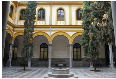
El Centro de Cálculo se instaló inicialmente en la Facultad de Derecho, en la primera planta del claustro de la calle Duquesa

otras autoridades, y, como era tradicional en aquella época, las instalaciones fueron bendecidas por el capellán de la universidad, siendo el acto y esta última circunstancia recogidos gráficamente por la prensa local. Ver IDEAL de 14/11/1972; página 11 ).